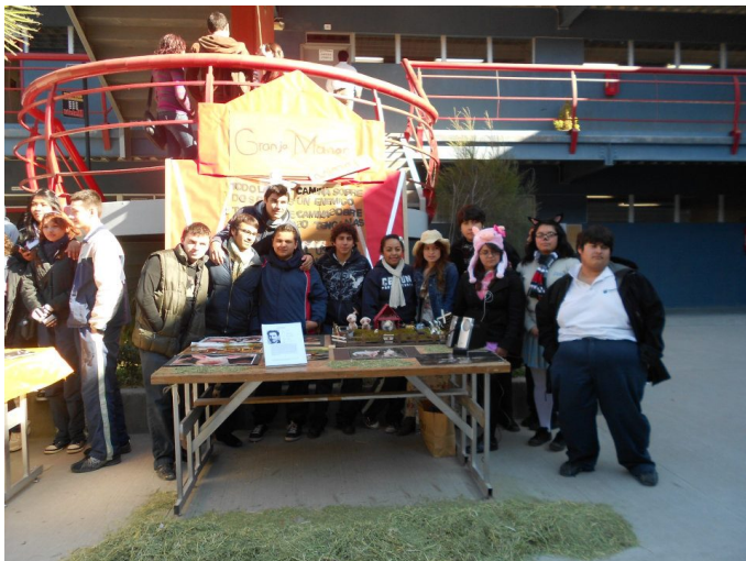
Figura 4. Estudiantes de tercer semestre en su módulo informativo inspirado en la novela La rebelión en la granja, de George Orwell

El festival fue coordinado por dos profesores de las materias Filosofía y Lengua y Literatura, respectivamente; cada uno de ellos otorgó una ponderación por la participación que se vería reflejada en la calificación del tercer parcial; la institución otorgó previamente los permisos para mover a los alumnos del salón a la explanada y audiovisual, solicitó el apoyo de los demás docentes para mantener el orden; sin embargo y aunque los resultados fueron favorables porque los