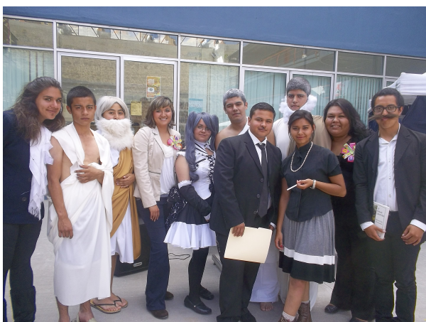
Figura 5. Representación de un filósofo favorito, por alumnos de sexto semestre

descripción y la exposición) sin excluir la realización de una obra artística. Los módulos participaron en un concurso cuyos criterios de evaluación fueron la originalidad de las piezas, técnica y exposición clara del tema.