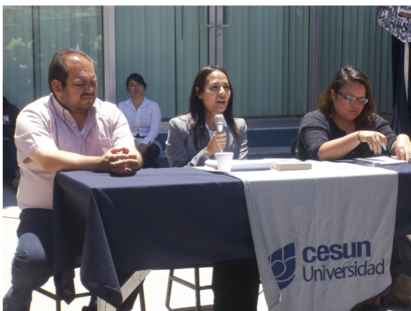
Figura 6. Los profesores de Idiomas, Orientación e Historia hablan sobre cómo descubrieron el gusto por la lectura.

Tras los resultados favorables del primer festival, el segundo evento homónimo tuvo el propósito de dar continuidad al plan lector que la institución educativa había esbozado un ciclo escolar anterior con la solicitud de novelas para